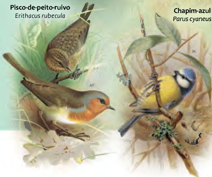
Chapim-azul Parus cyaneus